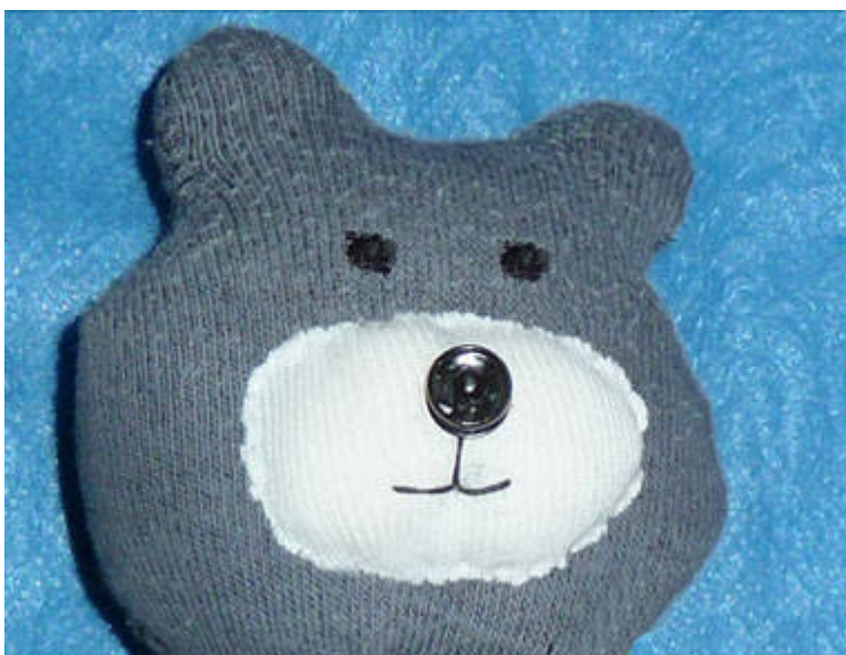
ե) Սպիտակ շրջանակների վրա ամրացված սև շրջակներից