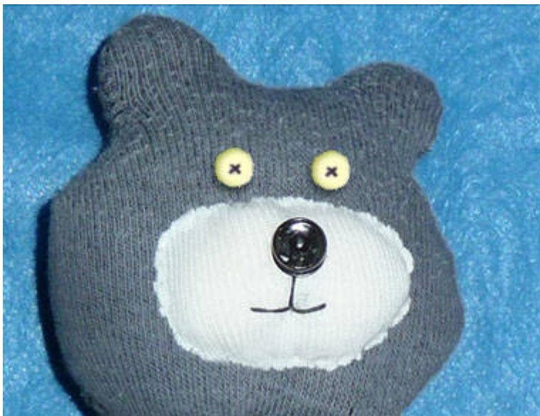
դ) Սև կտորե շրջանակներից`