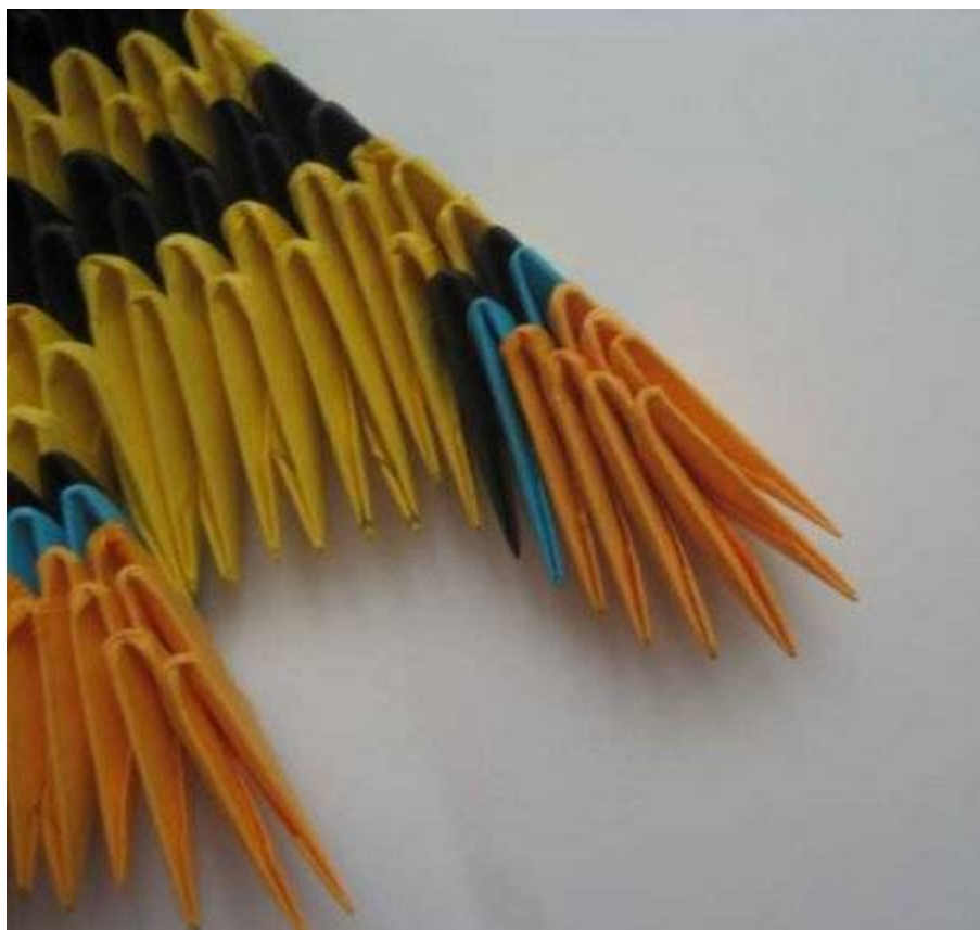
Ձկնիկը պատրաստ է .